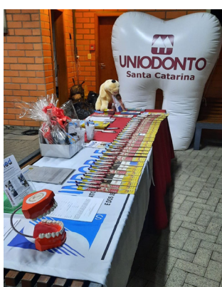
Stand Uniodonto e Sindgraf na All4Labels Gráfica do Brasil.