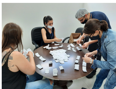
Contagem dos votos PPRL na All4Labels Gráfica do Brasil.