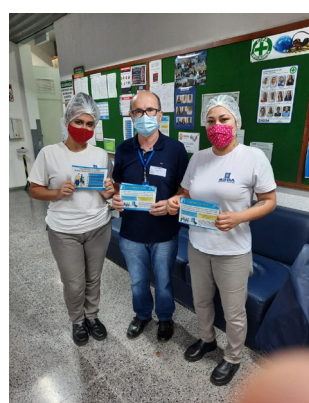
Entrega de convites para Assembleia na Gráfica 43 SA.