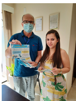
Entrega de convites para Assembleia na Gráfica Noldin.