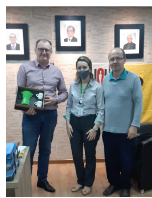
Visita corterias da cooperativa parceira Sicredi.