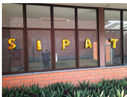
Semana SIPAT na All4Labels Gráfica do Brasil.