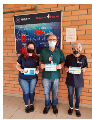
Entrega de convites para Assembleia na All4Labels Gráfica.