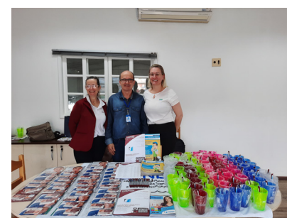
Visita do Sindgraf na MKM Karton.