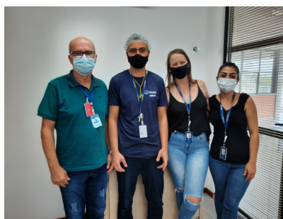
Contagem dos votos PPLR na All4Labels Gráfica do Brasil.