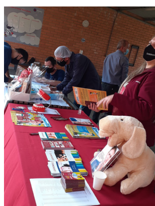
Colaboradores se associando ao Sindgraf.