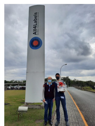
Entrega da Cesta ao ganhador na All4Labels Gráfica do Brasil.