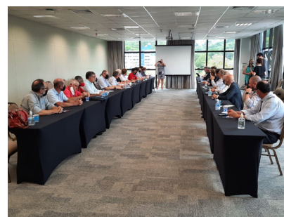
Participação do presidente do Sindgraf nas reuniões do PISO Estadual.